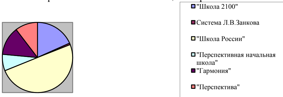
Вариативность начального общего образования

На базе МОУ открыто 26 групп продленного дня (далее - ГПД) с общей наполняемостью 598 учащихся. Группы открыты в основном на первых (смешанные группы) и вторых классах.