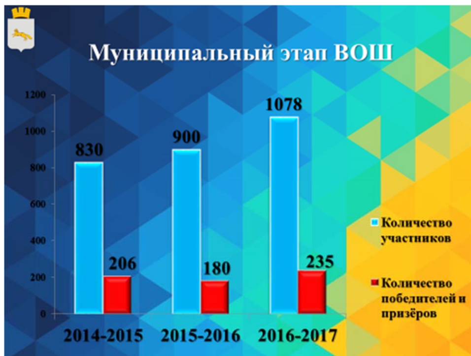
Количество участников и количество победителей и призеров муниципального этапа ВОШ